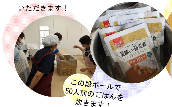
この段ボールで 50人前のご飯を 炊きます！