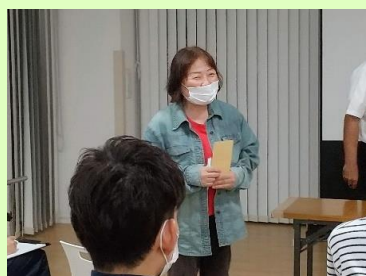
「これからも ありがとう の気 持ちは伝えていこうと思 います」

感染予防のために集まる機会が少なくなっているから こそ、有意義な時間となりました。