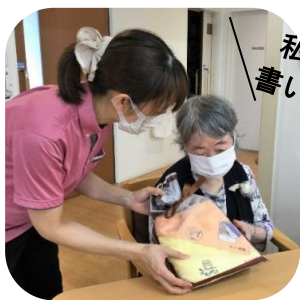
私の名前が 書いてある！