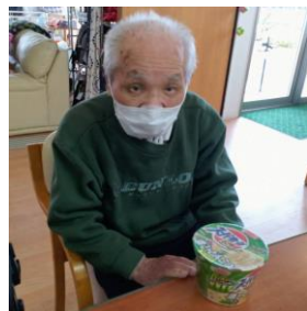
まだですよ～ 3分待ってくださいよ～

きっかけは新聞広告を見ていて、食べたいな～という声を聞いて…じゃーみんなで食べようか！ となりました 3分が待ちきれず、フタを開けてまだかな？なんて方もいらっしやいましたよ