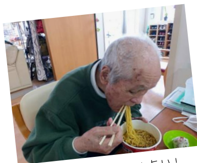
久しぶりに食べると旨い!

きっかけは新聞広告を見ていて、食べたいな～という声を聞いて…じゃーみんなで食べようか！ となりました 3分が待ちきれず、フタを開けてまだかな？なんて方もいらっしやいましたよ