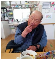
おやつにはひなあられと桜餅をいただきました とてもいい笑顔で喜ばれていました