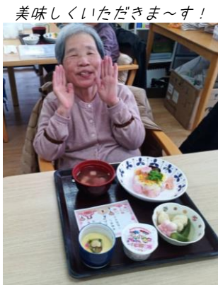
美味しくいただきます！