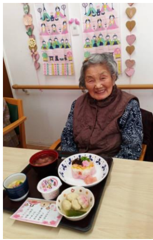
花の押し寿司が可愛いね ♡